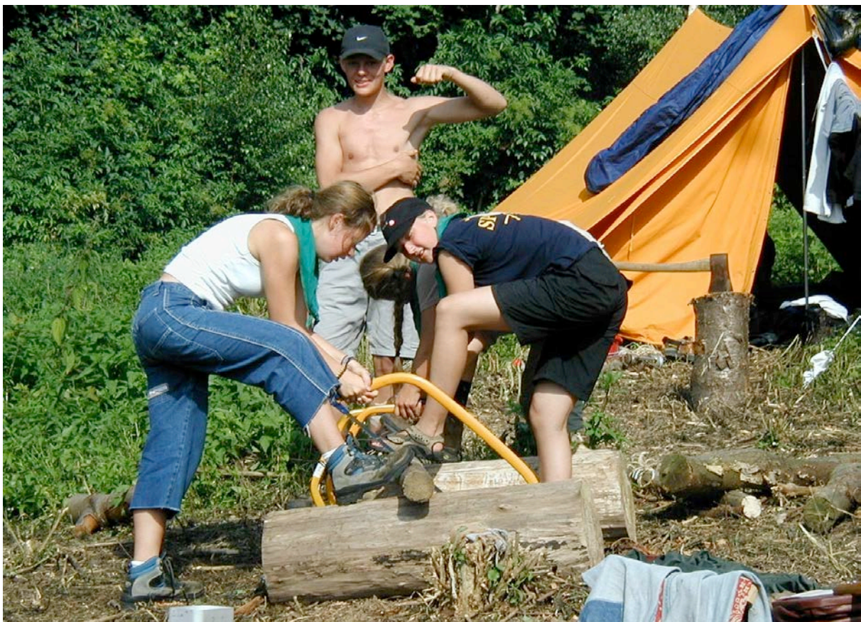
Brændesavning på samleband.