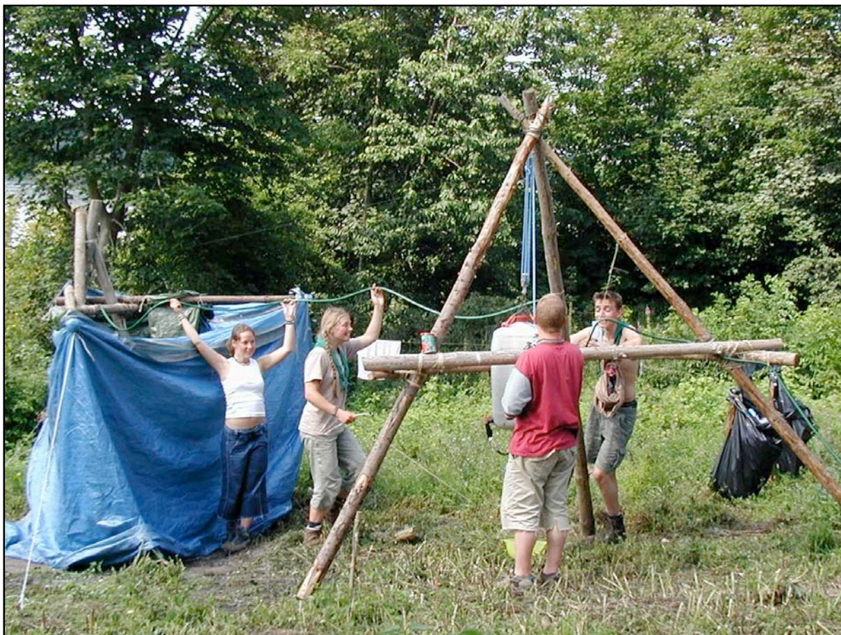
Vandvarmeren og brusekabinen er ved at fungere.