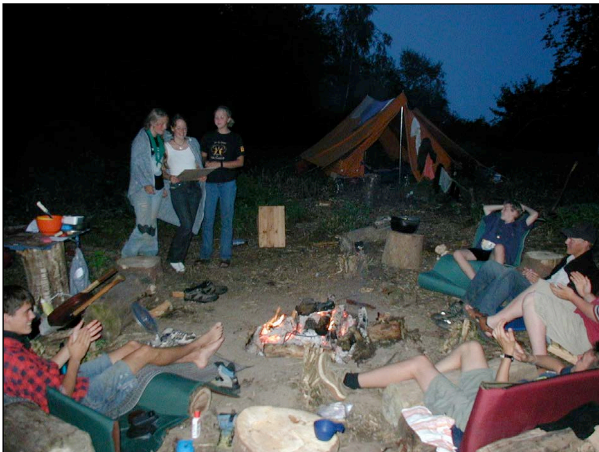
Lejrbål med sang og underholdning.