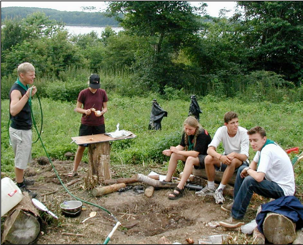
En arbejder, en anden prøver, og tre...