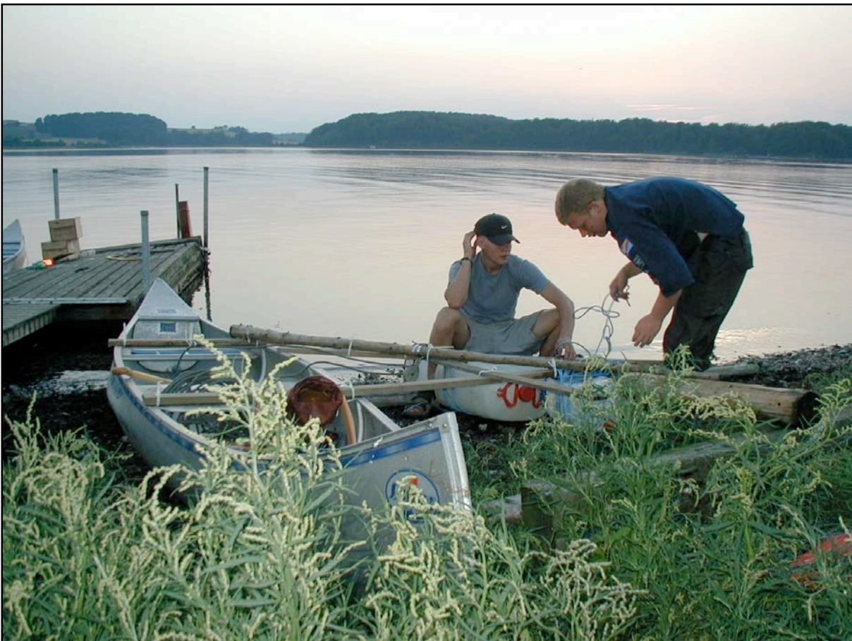
Kano eller katamaran?