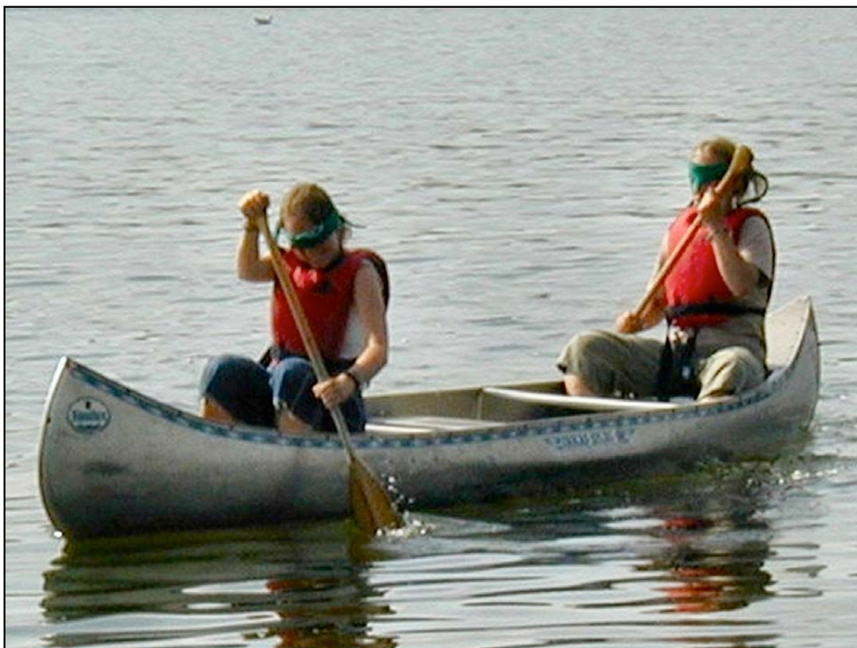
Kanopadling i blinde - hvert hold padler en bane igennem dirigeret af en styrmand på land.