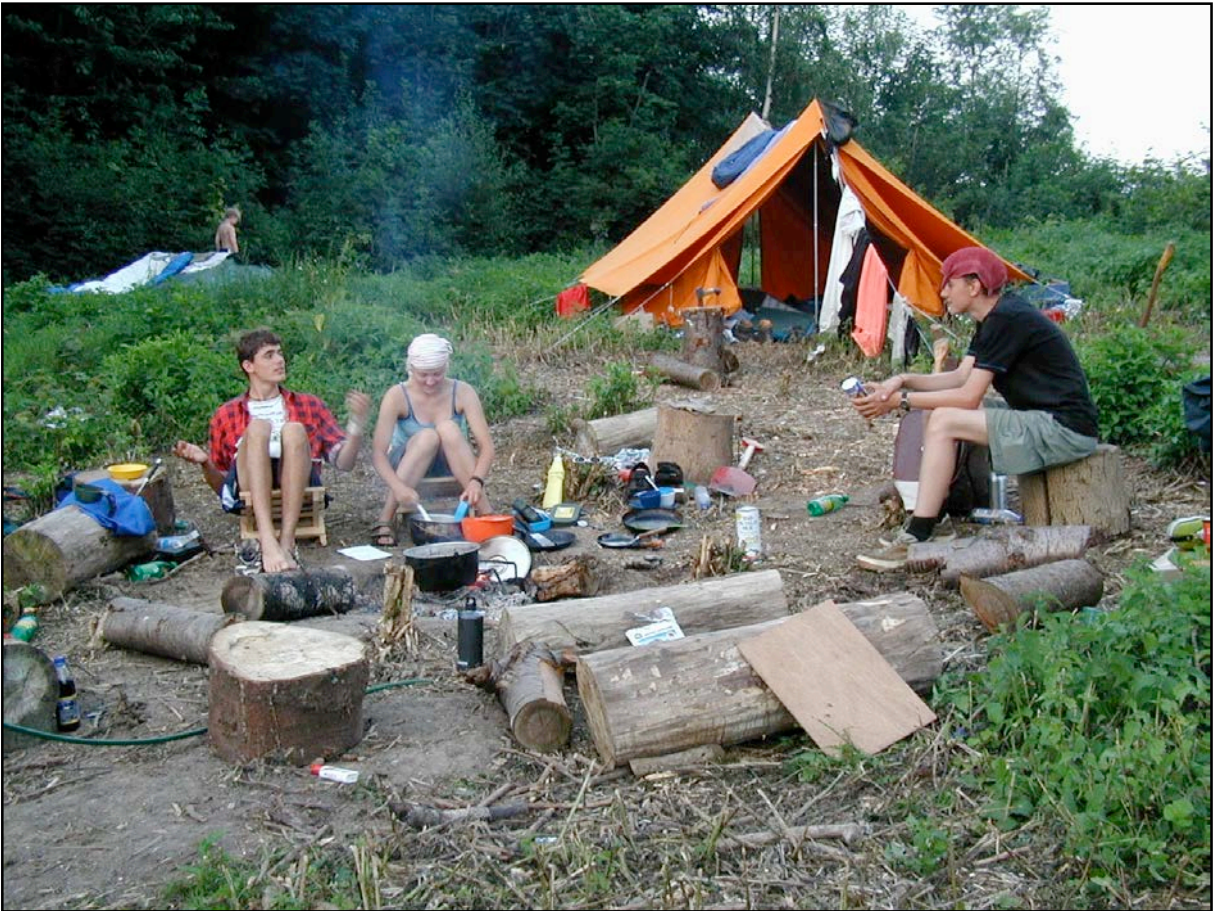
Find fem fejl.