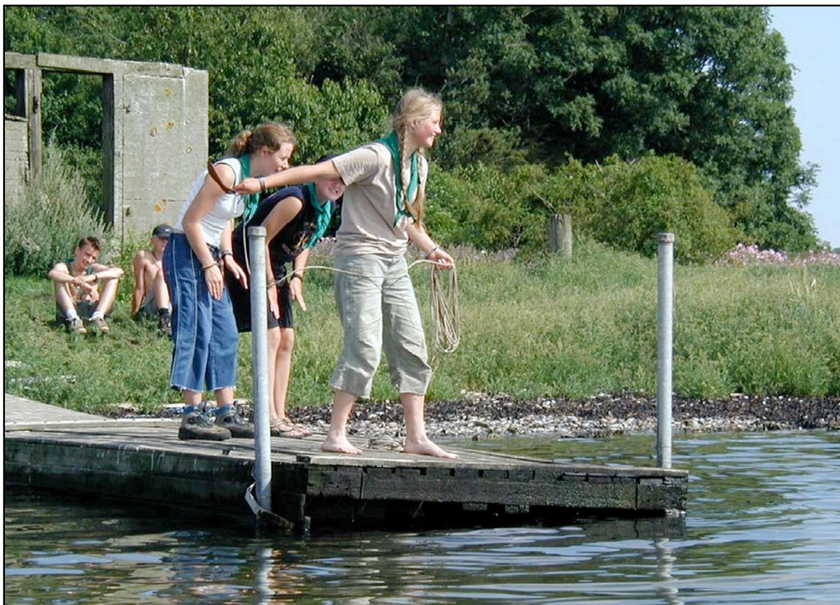
Kast med redningsreb - pigerne kaster og drengene ser til.

Kære dagbog - vores morgen startede med et par udkørte spejdere og gæster. Vi har alle prøvet at ligge i et telt i nat. Hygsomt - hvis ikke man bliver klemt. En lille fejl fra Ludvigs side gjorde, at vi ikke kunne få den daglige dosis havregrød, men måtte nøjes med cornflakes. Det kunne man mærke på folk.