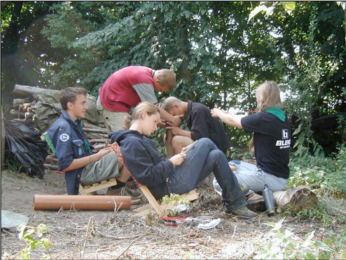
Middagspause på en skyggefuld plet.